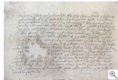
1530 urtean Zumaian ospatutako Batzarren erregistroa. GAO/AGG.

Lehen instantzian hainbat gai epaitzen ziren: larreei buruzko Probintziako ordenantzak ez betetzeagatik sortzen ziren auziak, Probintziak Ahaide Nagusiekin konpondu gabe zeuzkan arazoak, Probintziako bi kontzejuk (udalek elkarren artean zituzten auziak edo partikular baten eta kontzeju (udal) baten arteko desadostasunak, indarkeriazko kasu kriminalak, eta abar.