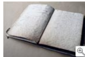
Batzarren Erregistroa. 1711-1712. GAO/AGG.