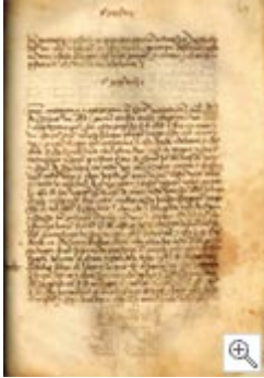
"Libro de los Bollones". 1481-1505. GAO/AGG.

1457an idatzitako Probintziako ordenantzetan (legeetan) Batzar Nagusiak egiteko haran eta hiriak zehazten dira. Hiru haran dira: Segura eta Ordiziako Harana, Arrasate eta Bergarako Harana eta "Valle de la Marisma" izenekoa. Era berean, haran bakoitzaren barruan bilerak zein herritan egingo diren ere adierazten da. Aurreneko haranean, Segura, Ordizia, Tolosa, Hernani, Villanueva de Oyarzun (Errenteria) eta Hondarribia sartzen dira. Bigarren haranean, Arrasate, Bergara, Elgoibar, Azkoitia, Azpeitia eta Zestoa. Hirugarren haranean, berriz, Donostia, Getaria, Zarautz, Zumaia, Deba eta Mutriku ziren Batzarrak egiteko aukeratutako herriak.