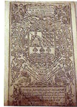
Batzarren eta aldundien akten liburua. 1711-12 (AGG-GAO)