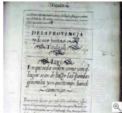
"Recopilación de Leyes y ordenanzas de la M.N y M.L. Provincia de Gipuzkoa", "Recopilaciones de Zarategi y Cruzat" izenarekin ezagutzen den Foru koadernoak. GAO/AGG.

Batzar Nagusiek epe jakin baten barruan beren aurrera azaltzeko dei egin ziezaioketen Probintziako edozein herritarri. Era berean, Batzarrek Lurraldean bakea zaintzeko eginkizuna zuten, Kontzejuek edo Ahaide Nagusiek (Gipuzkoako handikiek) sortarazten zituzten istilu eta liskarrak baketuz. Horregatik, Batzarrek ordenantzak bete zitezen begiratu behar zuten, ordena publikoa urratzen zuten bazter-nahasle eta liskarzaletan zigor zibil eta kriminalak ezarriz. Kontrol eta gainbegiratze lan horri dagokionez, epaile arrunten eta Ermandadekoen epaiak eta aginduak ezin ziren burutu, baldin eta Batzar Nagusiek haiek ikusi eta onartzen ez bazituzten.