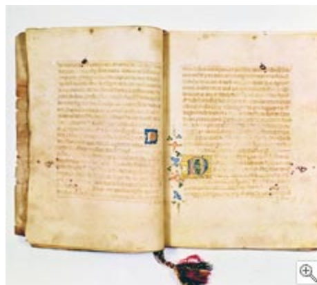
1453ko Ordenantzak. GAO/AGG. Arrazkia: GAO/AGG

Aipatutako Gipuzkoako Ermandade Nagusia osatzen zutenek, jakina, biltzarrean bildu behar izaten zuten aldian behin, gaiak aztertu eta erabakiak hartzeko. BILKURA edo biltzar horiek Batzar izenez ezagutzen ziren. Gipuzkoa oso ordezkatzeko zutenekotzat jo daitezkeen lehenengo Batzarrak 1397. urtekoak dira, eta Getarian bildu ziren. Hurrengo idazpuruak haiei buruzkoak eta haien ezaugarri eta bilakaerari buruzkoak dira.