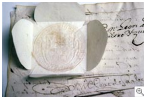
Sello de Juntas. Sin Fecha. GAO/AGG.